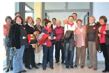
Foto: Beim Treffen im St. Josefstift mit Pflegedienstleiter Herr Eitner und Kolleginnen aus Dresden.

Das von unserem ICE-Mitglied Frau Judit Muskovszky angeregte Projekt, bei dem es um Austausch zwischen „Grünen Damen“ aus Ungarn und aus Deutschland, um das Kennenlernen sozialer Einrichtungen sowie um die Weiterbildung im ehrenamtlichen Engagement geht, wurde im Oktober dieses Jahres zum 2. Mal mit Erfolg durchgeführt und soll 2012 fortgesetzt werden. Ein Besuch Grüner Damen aus Dresden in Budapest ist auch geplant.