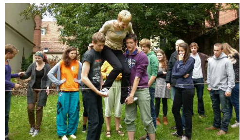
Foto: Dt.-russ. Begegnung in der Sächsischen Schweiz

38 Freiwillige sind im neuen Internationalen Jugendfreiwilligendienst/ IJFD, 6 im „weltwärts“-Programm und 17 im Europäischen Freiwilligendienst/ EFD. Sie leisten ihren Dienst in Belgien, Estland, Frankreich, Großbritannien, Italien, Niederlande, Polen, Rumänien, Russland, Tschechien, Ukraine und Ungarn. Neu sind z.B. eine Arche-Gemeinschaft in Preston (GB) und 3 EFD-Stellen in Ungarn.